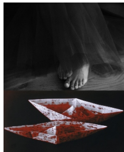
FarAway - Pintura fotografia/ID - 120 cm X 90 cm - 2005

Exposições Colectivas: 2006 "PERSPECTIVAS - 7 OLHARES", RDP ÁFRICA 10 Anos, Quarteira, Porto, Coimbra e Inst. Franco Português, Lisboa | 2005 Feira de Arte Contemporânea, Lisboa | 2004 Galeria Diferença, Lisboa | 2000 Feira de Arte Contemporânea, Lisboa | 1999 Park of the future 99, Amsterdam | AR.CO Bolseiros e finalistas Lisboa | América Latina 500 Anos Depois Casa da América Latina, Lisboa | 1997 Bienal de Arte Contemporânea, Leiria | Exposição de Verão AR.CO, Lisboa | 1996 Exposição de Verão AR.CO Lisboa Festival | X Espaço Ginjal, Almada |