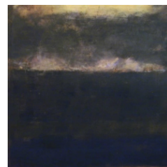
My Neverland - Mistral/lela - 100 cm X 100 cm - 2005

Exposições colectivas: 2006 "PERSPECTIVAS - 7 OLHARES", RDP ÁFRICA 10 Anos, Quarteira, Porto, Coimbra e Inst. Franco Português, Lisboa | 2005 Galeria Corrente D'arte, Lisboa | Galeria Acontece, Lisboa | Galeria 57, Leiria | 2003 Galeria 57, Leiria | Galeria Santiago, Palmela | Galeria Magia Imagen, Lisboa | Galeria Corrente D'Arte, Lisboa | 2001 Governô Regional da Madeira, Funchal | 2000 Bienal de Alenquer, Alenquer | Galeria Magia Imagen, Lisboa | 1999 Bienal do Alentejo, Évora | Internacional de Vila Real de S. Antonio, Vila Real de S. Antonio | 1998 Galeria JE, Lisboa | Galeria Art Konstant, Lisboa | Expo 98, Lisboa | Galeria Moira, Lisboa | 1997 Galeria Espaço Oikos, Lisboa | 1996 Bienal Lyons Club, Almada | 1994 Feira Internacional de Lisboa, Lisboa | 1983 Escola de Artes Visuais Antonio Arroio, Lisboa |