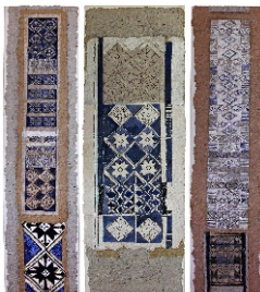
M'Bambala - Assemblage - 120 cm X 120 cm - 2006